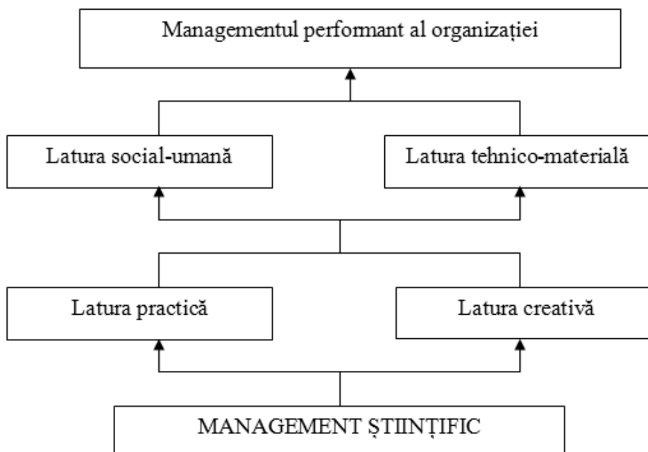
Figura 1. Laturile și finalitățile managementului științific (preluat și adaptat după V. Cornescu, I. Mihăilescu, S. Stanciu, 2003, p. 5)

Știința managementului este relativ nouă în comparație cu alte științe. Aceasta a luat naștere și s-a dezvoltat o bună perioadă de timp în domeniul economic. Evoluția socială a impus extinderea aplicării conceptelor științei managementului și în domeniile noneconomice, între care și sportul.